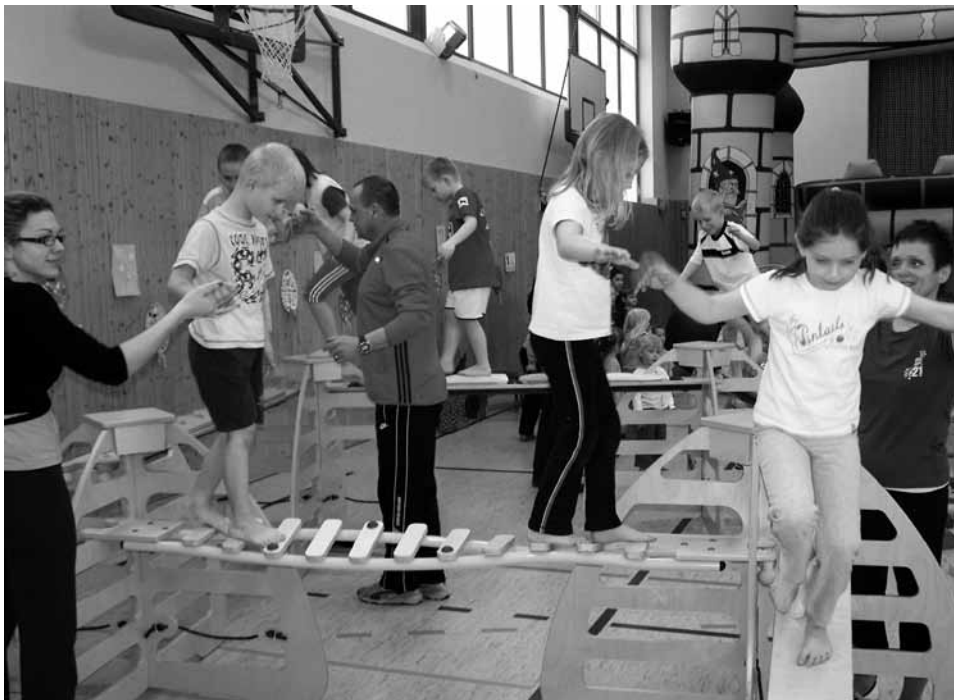
Die Kinder beim Trainieren ihres Gleichgewichts