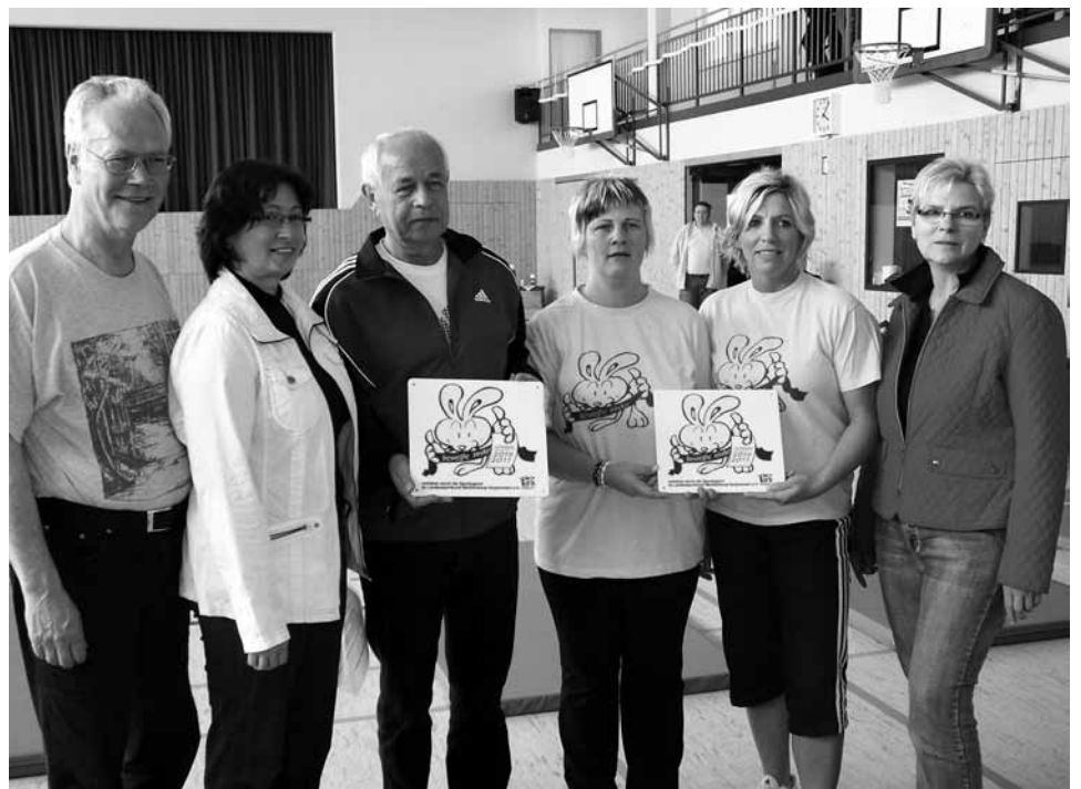
Freude in Bad Kleinen über die Auszeichnung