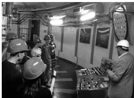
Der Rundgang durch das Kernkraftwerk war sehr interessant