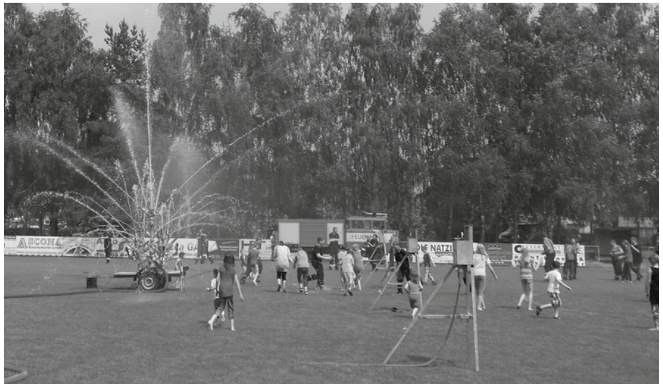
Der Stahlrohrbaum sorgte für Erfrischung

war ebenfalls ausreichend gesorgt, u. a. gab es ein leckeres Kuchenbuffet. Als weiterer Höhepunkt wurde in der Mittagshitze der „Strahlrohrbaum“ aus dem Feuerwehrmuseum in Betrieb genommen. Gespeist durch zwei Löschfahrzeuge war die erzeugte Wasserfontaine eine willkommene Abkühlung, besonders für die Kinder. Nach der Siegerehrung am Nachmittag gab es für alle Wettkämpfer, Helfer und Besucher eine Ruhepause, bevor es am Abend mit dem Feuerwehr-