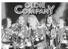
Oldie Companie Promotion

Am Sonnabend, dem 07.03.2015 , bittet die „Oldie Company“ in der Dorf Mecklenburger Mehrzweckhalle mit Hits aus den Goldenen Zeiten des Rock 'n' Rolls zum Tanz. Die professionelle Rockband ist nicht nur im Wismarer Raum eine feste Größe für alle, die sich auf einen Tanzabend in voller Halle mit ausgelassener Stimmung freuen. Einlass am 07.03. ist um 20.00 Uhr, Beginn der heißen Rock-Nacht ist um 21.00 Uhr. Karten gibt es in „Mannis Eck“ und in der Mehrzweckhalle Dorf Mecklenburg für alle, die gerne in der Nähe der Tanzfläche sitzen, bereits jetzt für 17 Euro im Vorverkauf.