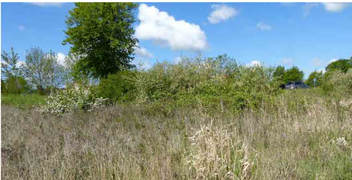
Abbildung 13: Ruderalflur im Südwesten des Vorhabengebietes.

Im Westen des Plangebietes, angrenzend an die bestehende Bebauung befindet sich ein Siedlungsgehölz mit überwiegend Brombeeren aber auch Holunder und Zaunwinde. Mit Umsetzung der Planinhalte gehen hier Habitate verloren, die hier angesiedelten Arten können jedoch in Bereiche nördlich und südlich des Plangebietes ausweichen.