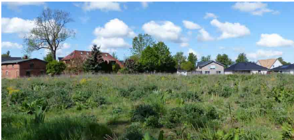
Abbildung 8: Spontanvegetation mit oben genannten Arten.