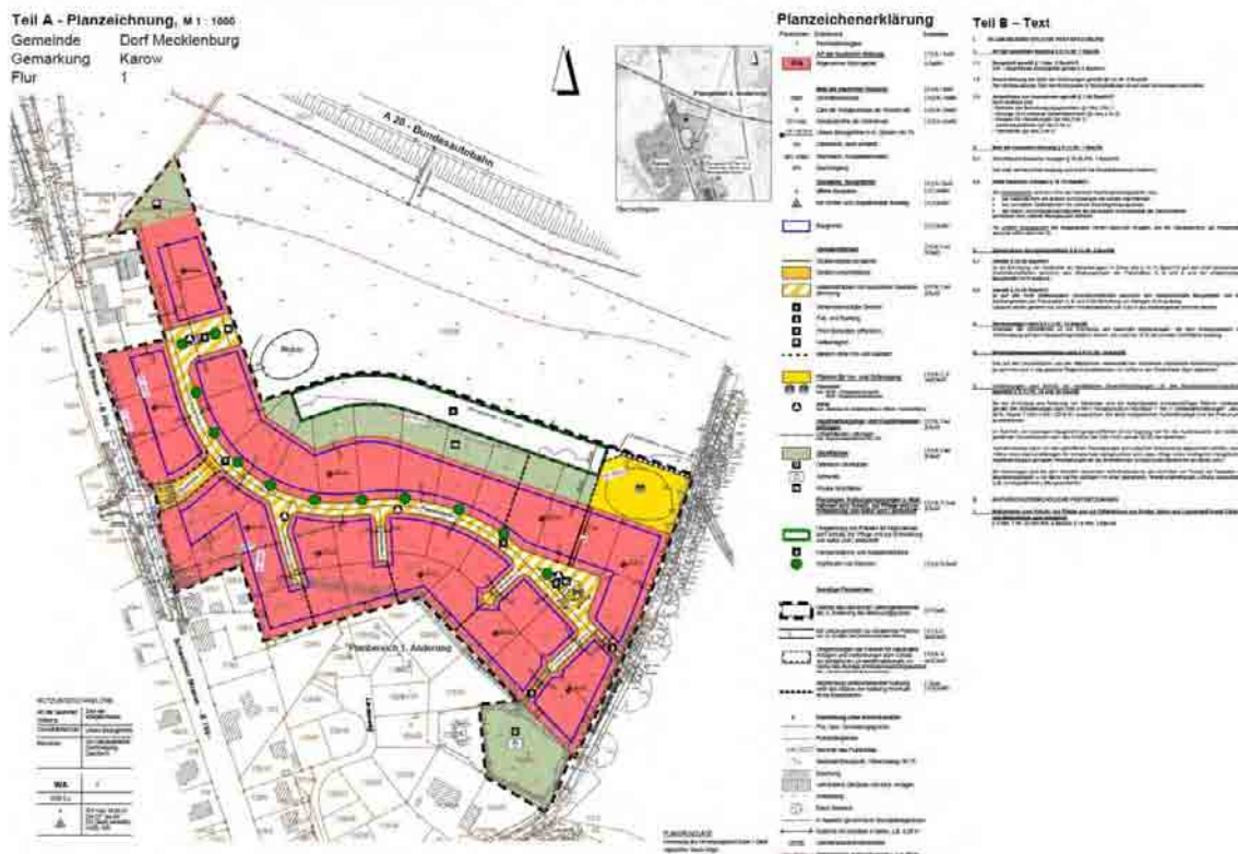
Abbildung 1: Ausschnitt Bebauungsplan Nr. 5 – Satzung über 5. Änderung, Darstellung des Plangebietes.