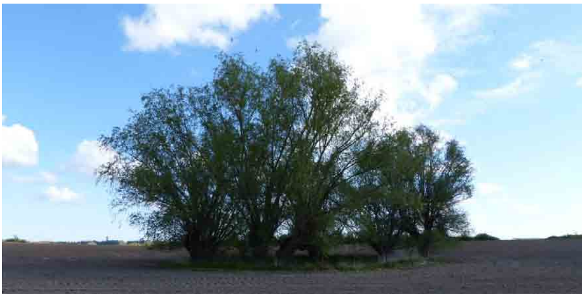
Abbildung 4: Blick aus Vorhabengebiet auf Biotop Nr. 1 NWM 11890.

Das Biotop Nr. 1 NWM 11890 (Abb. 4) liegt direkt östlich des Geltungsbereiches des B-Plans. Es wird mit einem Abstand von 7 m zur Plangrenze berücksichtigt, direkte oder mittelbare Beeinträchtigungen können ausgeschlossen werden, da die Funktionsfähigkeit weiterhin gewährleistet ist. Zum Zeitpunkt der Kartierung am 14.05.2019 war das als permanentes Kleingewässer gekennzeichnete Biotop mit Weiden umstanden. Wie aus Abb. 5 ersichtlich wird, ist das Biotop jedoch infolge der extrem trockenen Witterung in den Jahren 2017 und insb. 2018 trocken gefallen.