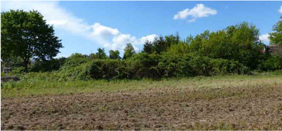
Abbildung 12: Siedlungsgebüsch aus einheimischen Pflanzen innerhalb des Geltungsbereiches.

Im Westen des Plangebietes, angrenzend an die bestehende Bebauung befindet sich ein Siedlungsgehölz mit überwiegend Brombeeren aber auch Holunder und Zaunwinde. Mit Umsetzung der Planinhalte gehen hier Habitate verloren, die hier angesiedelten Arten können jedoch in Bereiche nördlich und südlich des Plangebietes ausweichen.