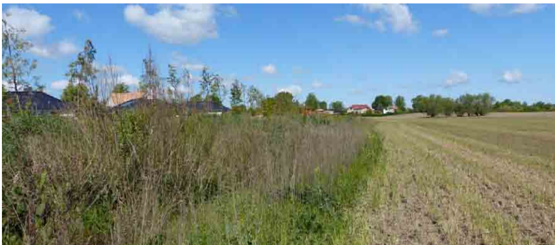
Abbildung 9: Staudensaum auf Böschung, hier wachsen u.a.: Beifuß, Krauser Ampfer, Brennnessel, Klee, Löwenzahn, Acker-Kratzdistel, sowie Raps.