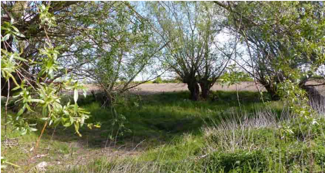
Abbildung 5: Trocken gefallene Senke, in Randbereichen überwiegend mit Gr. Brennnessel bewachsen, Umstanden von Kopfweiden.

Vom Plangebiet gehen bereits abstandsbedingt sowie zusätzlich durch abschirmende Wirkung des nördlich vorgesehenen Lärmschutzwalls keine direkten und mittelbaren erheblichen Beeinträchtigungen der gesetzlich geschützten Biotope in der Umgebung des Plangebietes aus, artenschutzrelevante Sachverhalte ergeben sich nicht.