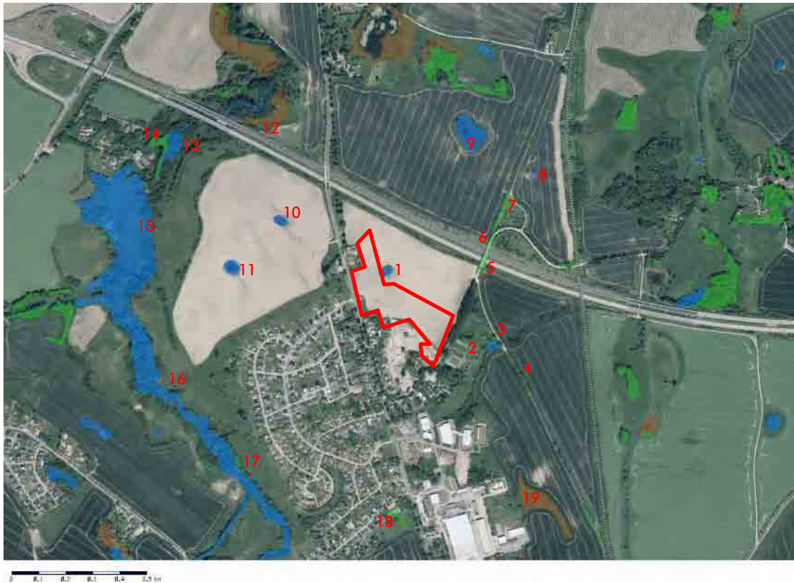
Abbildung 3: Luftbild des von der Planung betroffenen Umfeldes mit Darstellung der geschützten Biotope, rot umrandet=Plangebiet.

Im Plangebiet bzw. daran angrenzend befinden sich gemäß Biotopkataster M-V nachfolgend aufgeführte geschützte Biotope: