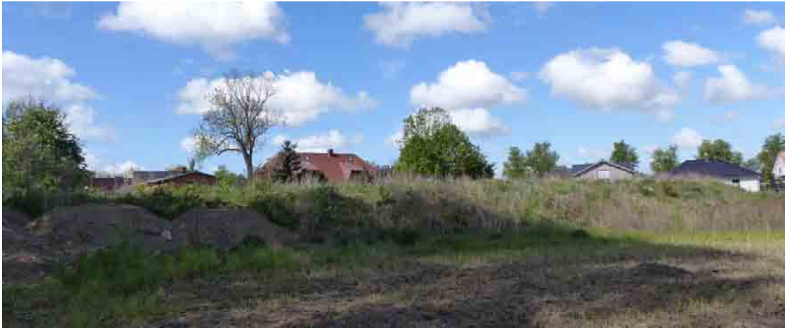
Abbildung 7: Erdmiete mit Spontanvegetation.

Taubnessel, Acker-Kratzdistel und Brennnessel. Mit Umsetzung der Planinhalte wird die Erdmiete erneut abgetragen und eine öffentliche Grünfläche mit Spielplatz errichtet. Der Staudensaum, der sich entlang der Böschung an der westlichen Grenze des Vorhabengebietes gebildet hat, bleibt mit Umsetzung der Planinhalte zum Teil erhalten.