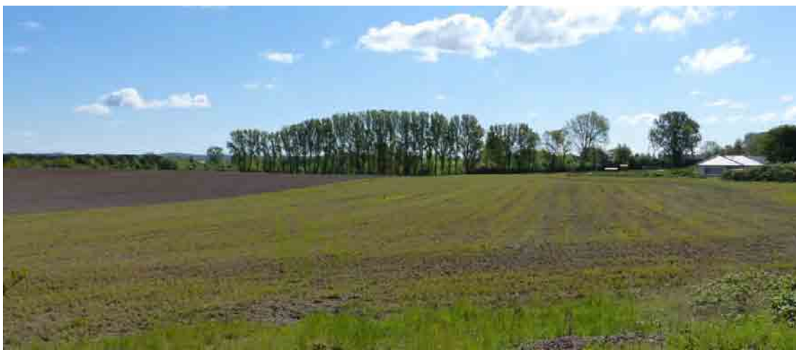
Abbildung 6: Ackerfläche, die den überwiegenden Teil des Plangebietes darstellt.

Das Plangebiet stellt sich zum Zeitpunkt der Kartierungen (05.12.2018, 14.05.2019) überwiegend als intensiv genutzte Ackerfläche (ACS) dar, des Weiteren sind außerdem die Biotoptypen „nicht- oder teilversiegelte Freifläche, teilweise mit Spontanvegetation – PEU“, Ruderaler Staudenflur frischer bis trockener Standorte – RHU“ sowie „Siedlungsgebüsch aus heimischen Arten – PHX“ vorzufinden. Die Fläche ist mit Ausnahme zweier Siedlungsgebüsche gehölzfrei.