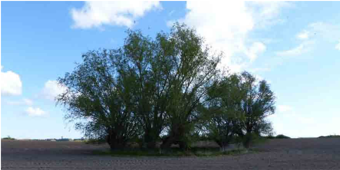
Abbildung 10: Biotop NWM 11890 (Biotop Nr. 1 in Abbildung 3).

Im Nordosten grenzt das Vorhabengebiet an das gesetzlich geschützte Biotop NWM 11890 (Biotop Nr. 1 in Abb. 3). Im Umweltkartenportal ist das Biotop als permanentes Kleingewässer mit undiff. Röhricht und Weiden gekennzeichnet. Zum Zeitpunkt der Kartierung am 14.05.2019 stellte es sich als trocken gefallene Senke dar, welche in den Randbereichen durch einen Staudensaum aus Gr. Brennessel (dominant) und Gräsern gekennzeichnet war. Das Biotop wurde im B-Plan mit einem Abstand von > 7 m zur Geltungsbereichsgrenze berücksichtigt.