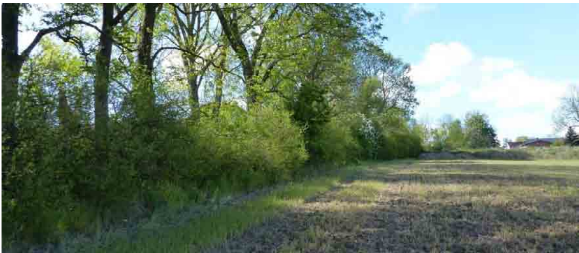
Abbildung 11: Baumreihe aus Pappeln und Eschen am Rosenthaler Weg.

Im Nordosten grenzt das Vorhabengebiet an das gesetzlich geschützte Biotop NWM 11890 (Biotop Nr. 1 in Abb. 3). Im Umweltkartenportal ist das Biotop als permanentes Kleingewässer mit undiff. Röhricht und Weiden gekennzeichnet. Zum Zeitpunkt der Kartierung am 14.05.2019 stellte es sich als trocken gefallene Senke dar, welche in den Randbereichen durch einen Staudensaum aus Gr. Brennessel (dominant) und Gräsern gekennzeichnet war. Das Biotop wurde im B-Plan mit einem Abstand von > 7 m zur Geltungsbereichsgrenze berücksichtigt.