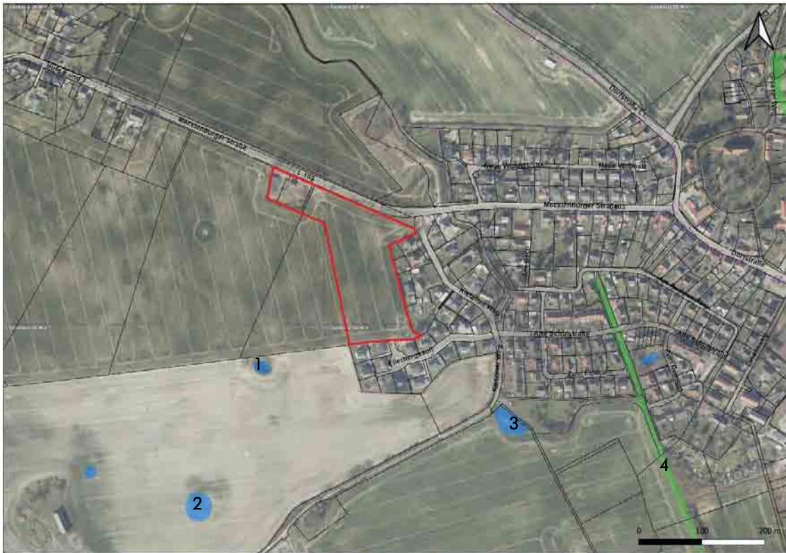
Abbildung 4: Luftbild des von der Planung (rot) betroffenen Umfeldes mit Darstellung der geschützten Biotope, rot umrandet=Plangebiet. Kartengrundlage: Geoportal MV 2022.

Im Plangebiet bzw. daran angrenzend befinden sich gemäß Biotopkataster M-V nachfolgend aufgeführte geschützte Biotope: