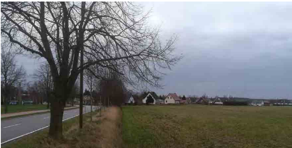
Abbildung 6: Baumreihe entlang der Mecklenburger Straße am westlichen Ortsrand von Lübow.