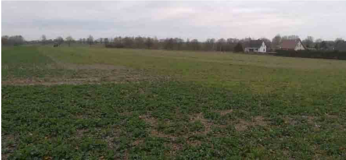
Abbildung 7: Der überwiegende Teil der Vorhabenfläche wird ackerbaulich genutzt.