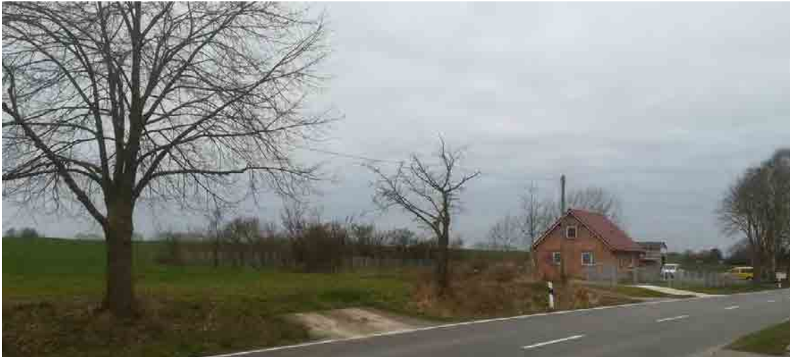
Abbildung 5: Blick auf Nordwesten des Plangebietes, hier Wohn- und Gewerbegrundstück von Siedlungshecke umgeben.

Die Eingriffe in Lebensräume und Boden werden in Kapitel 4.4 des Umweltberichtes quantitativ ermittelt.