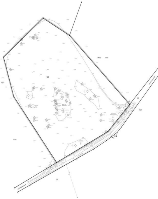
Abgrenzung des Geltungsbereichs

Untere Bodenschutzbehörde: Die Behörde fordert aufgrund der Altablagerung die Überdeckung der im Vorentwurf als „Gehölzfläche/SPE-Fläche“ bezeichneten Fläche mit einer 60 cm mächtigen Abdeckung aus bindigem Material zum Schutz Boden-Mensch und Boden-Grundwasser. Das zu überdeckende Biotop wäre dann ggf. auszugleichen.