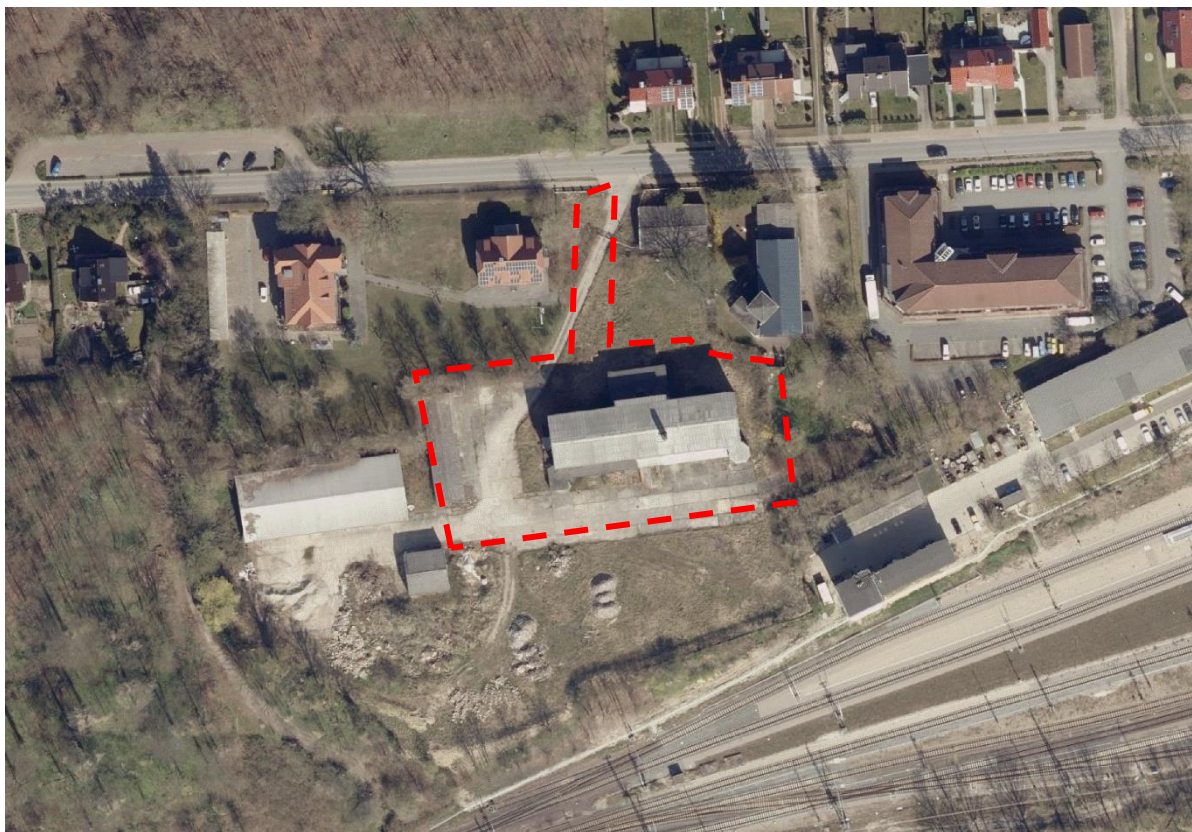
Luftbild des Plangebietes