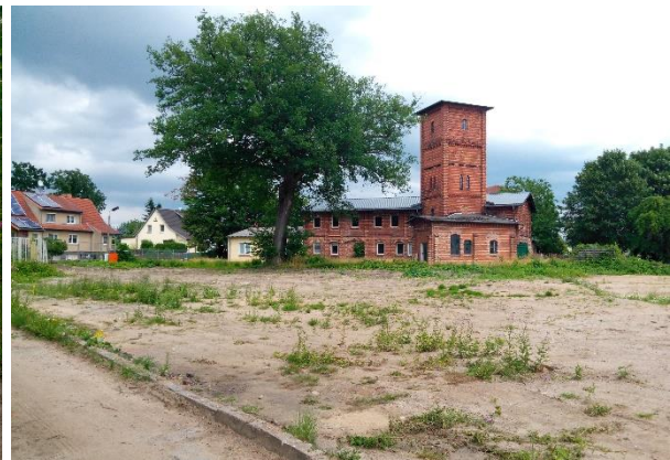
Blick vom Plangebiet auf den Wasserturm