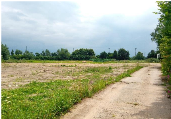
Blick auf des Plangebiet, Richtung Süden