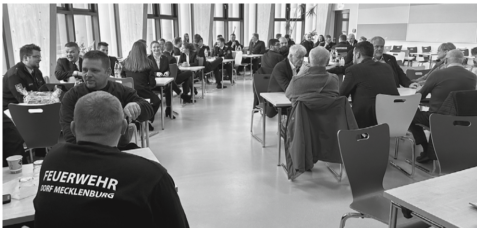
Die Mensa in Dorf Mecklenburg war bei der Übergabeveranstaltung gut gefüllt.