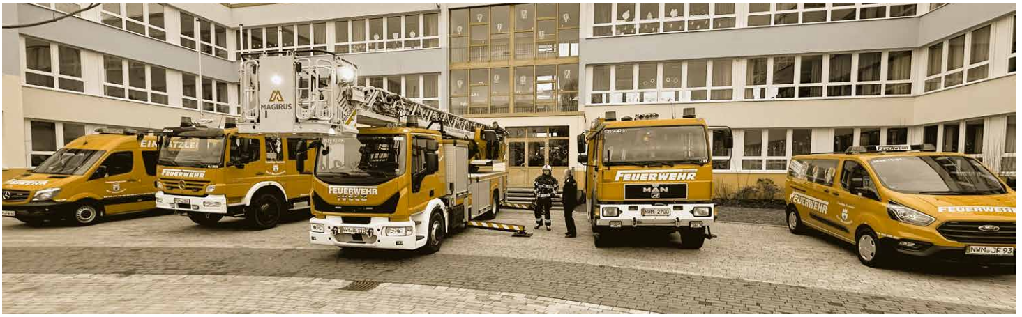
Großes Aufgebot der Freiwilligen Feuerwehr Dorf Mecklenburg am Übergabetag

Jährlich wird in neue Schutzausrüstung und Technik investiert, seit etwa zehn Jahren wurde um die Anschaffung eines Drehleiterfahrzeuges (DLAK) – und das für den gesamten Amtsbe- reich – gekämpft, jedes Jahr aufs Neue. Nun war es endlich so weit und das hochmoderne Feuerwehrauto stand auf dem Hof des Fuhrparks. Am 27. Januar wurde es in der Mensa der Schulen offiziell in Dienst gestellt, sprich von Status 6 (nicht dienstbereit) auf Status 2 (dienstbereit), das war genau um 10.35 Uhr Dorf Mecklenburger MEZ. Etliche Kameradinnen und Kameraden der Freiwilligen Feuerwehr Dorf Mecklenburg hatten sich am Morgen zu diesem Anlass ihre schicken Uniformen angezogen, und man spürte ihre Freude, nicht nur an diesem Vormittag einfach so zusammenzukommen und sich zu sehen, sondern auch ihren Stolz, so ein besonderes neues Fahrzeug für ihre Arbeit bei der Brandbekämpfung und anderen Tätigkeiten zum Schutze der Bevölkerung ab sofort zur Verfügung zu haben.