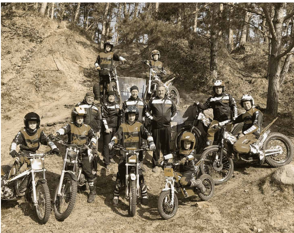
Trail-Fahrer nutzen den Sandberg zum Training und für Wettkämpfe (Team Sandberg des MC Wismar e. V. 2022).

Trotzdem bleibt der „Sandberg“ ein Erholungs- und Spannungsort im Winter wie im Sommer. Nach wie vor bauen Füchse und Dachse ihre Höhlen, und auch andere Wildtiere sind anzutreffen. Die Weiden, die zur Anhöhe führen sind auch ein kleines Paradies für die Tiere der Rinderanlage des Landhofes Bobitz. Von der Anhöhe hat der Wanderer auch einen wunderbaren Ausblick auf die modernen Stallanlagen, Sammelbecken und die Biogas-Anlage für die Erzeugung von Energie und Heißwasser. Die großen Solaranlagen zeugen auch von den Klimamaßnahmen des landwirtschaftlichen Betriebes. Betrachten wir 2023 die Hänge in der großen Kuhle, so sind sie schon bewachsen und teilweise begrünt. Sand wird nicht mehr abgefahren und somit bleibt der Berg erhalten.